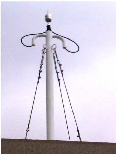
提前放電避雷針+塔座+鋼索安裝成功