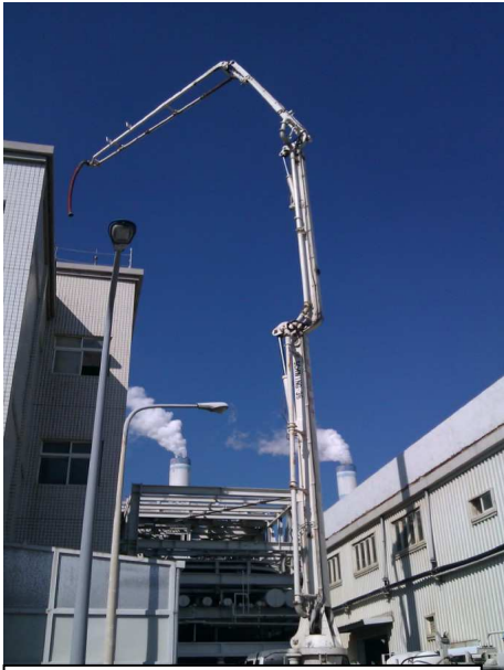
水泥壓送車至樓頂