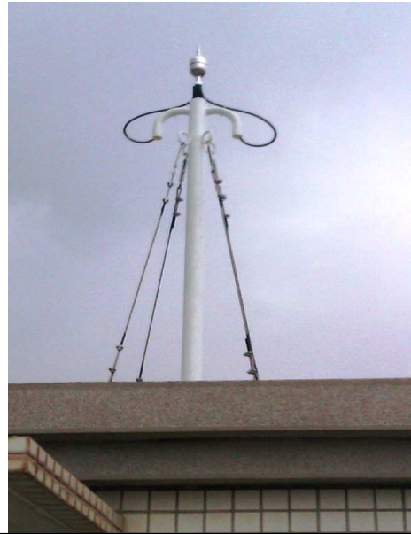
提前放電避雷針+塔座安裝成