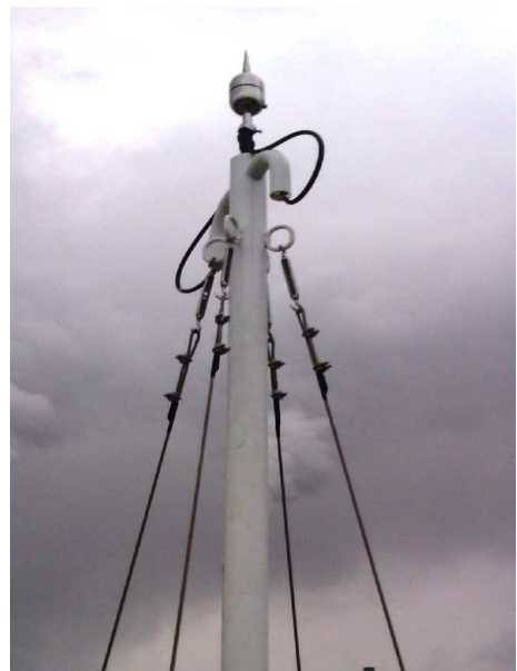
提前放電避雷針+塔座+鋼索安裝成功